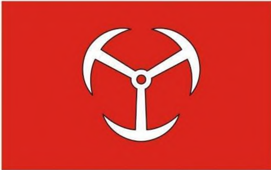
Flaga, proporcje 5:8